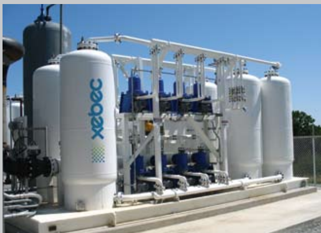
Le M-3100 de XEBEC permet de purifier des gaz d'enfouissement en Ohio et d'alimenter des clients grâce au réseau de gazoducs de Duke Energy.

Pour convertir les biogaz en une source économique d'énergie renouvelable, choisissez un système d'adsorption modulée en pression (AMP) compact de XEBEC offrant la technologie simple et fiable d'AMP à soupapes rotatives et à cycle rapide. Les systèmes d'AMP de XEBEC sont utilisés partout dans le monde pour éliminer avec efficacité le dioxyde de carbone (CO 2 ) des flux de gaz d'enfouissement, de gaz biologiques et de gaz issus des puits de pétrole tout en respectant des normes de qualité très strictes liées au carburant des véhicules et au gaz naturel transportable par pipeline.