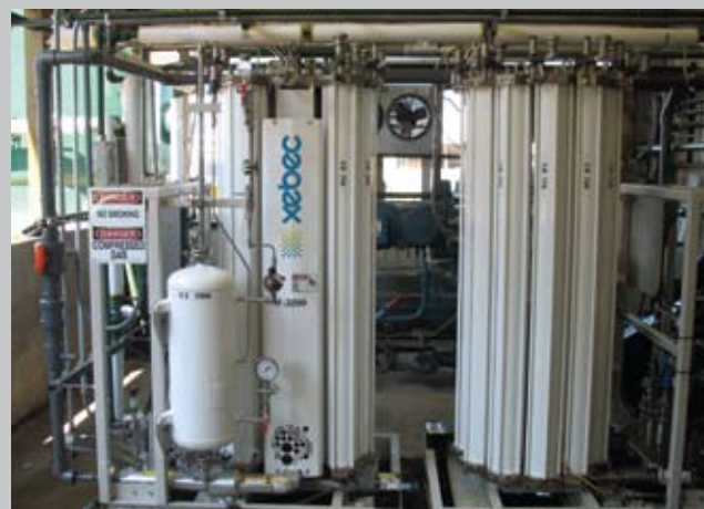
Le M-3200 de XEBEC permet de purifier les biogaz d'une ferme laitière et d'alimenter des clients grâce au réseau de gazoducs de Michigan Gas Utilities.